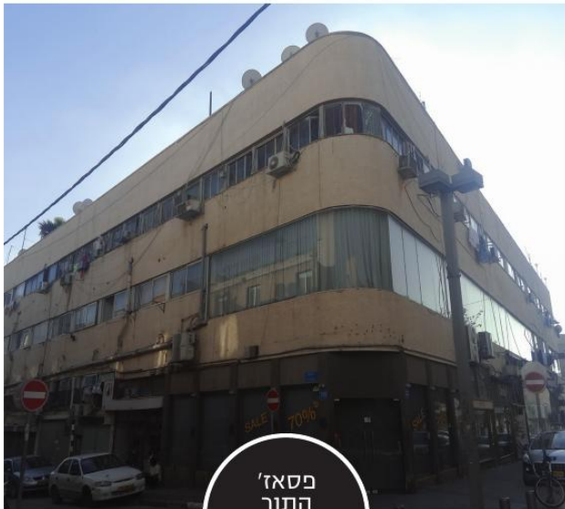
פסאז' התור וולבסון 79