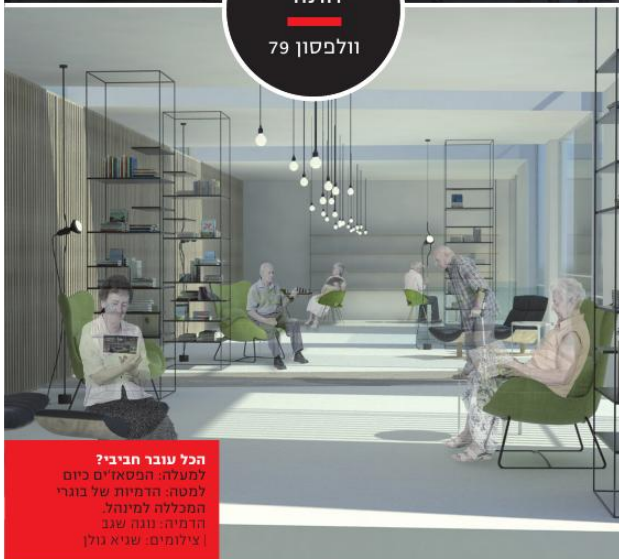
הכל עובר חביבי? למעלה: המסאז'ים כיום למטה: הדמיות של בוגרי המכללה למינהל הדמיה: טונה שגב